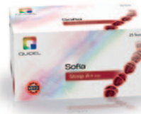
Strep A+ FIA