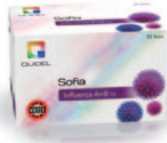
Influenza A+B FIA